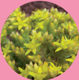
Orpin âcre

La création des plans d'eau a permis de favoriser la présence d'oiseaux aquatiques (grèbe huppé, héron cendré, martin-pêcheur, etc.) ou évoluant au-dessus de l'eau comme l'hirondelle de rivage. D'autres espèces rares ont été vues sur le grand étang comme le harle bièvre, le garrot à œil d'or ou encore le canard chipeau.