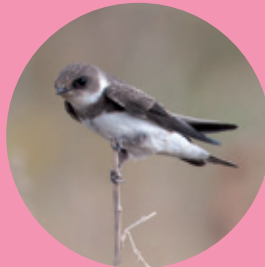
Hirondelle de rivage