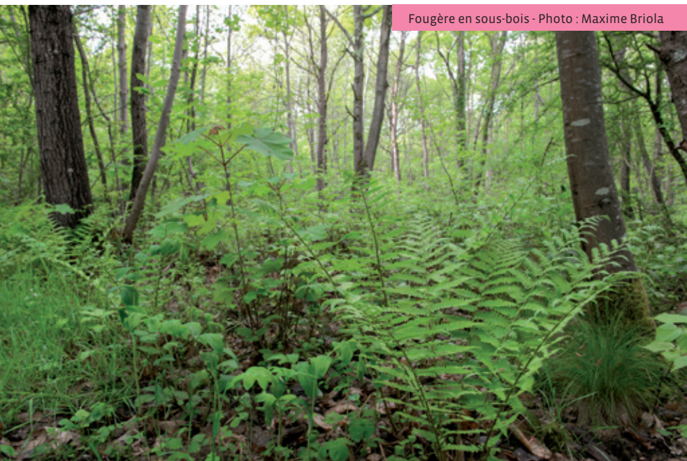
Fougère en sous-bois - Photo : Maxime Briola

Les gravières les plus profondes sont alimentées par la nappe alluviale de la Seine, permettant ainsi à une flore et une faune aquatique de s'installer : zannichellie des marais ou potamot à feuilles perfoliées pour les plus remarquables. Trois cent quarante-deux espèces végétales ont été recensées sur l'ENS, dont sept espèces sont protégées au niveau régional.