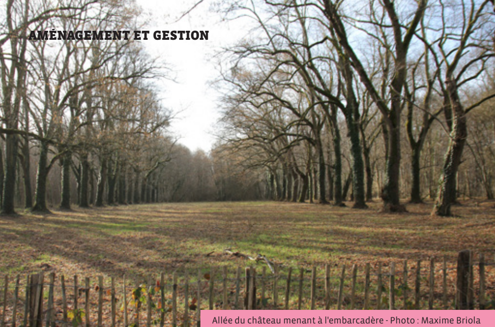
Allée du château menant à l'embarcadère