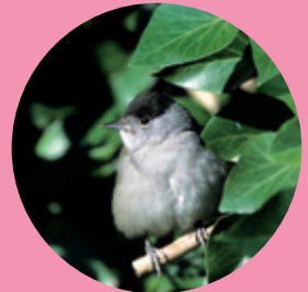
Fauvette à tête noire