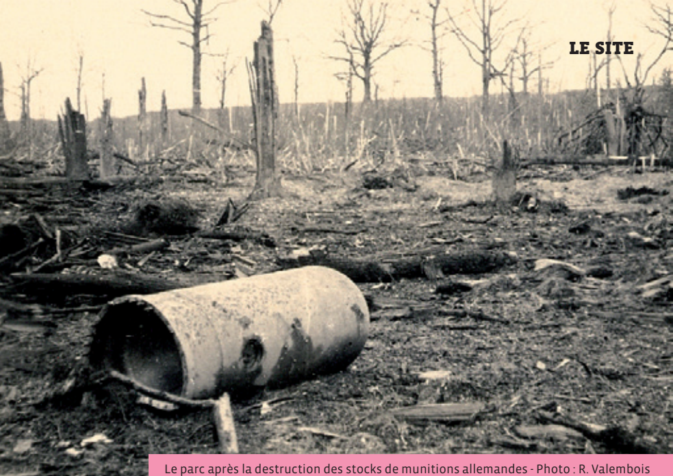
Le parc après la destruction des stocks de munitions allemandes

La Seconde Guerre mondiale marque le site d'une empreinte indélébile. À partir de 1943, le parc du château sert de dépôt de munitions pour les avions allemands basés à Villaroche, au nord de Melun. Après le débarquement du 6 juin 1944, tandis que les Alliés progressent, les Allemands préparent leur repli. Le mardi 22 août, après avoir prévenu la population, les derniers occupants font sauter le dépôt de munitions. Les explosions dévastent le parc, les arbres sont hachés et d'énormes cratères, encore visibles de nos jours, jalonnent le terrain. Elles font également voler en éclats les tuiles et fenêtres jusque