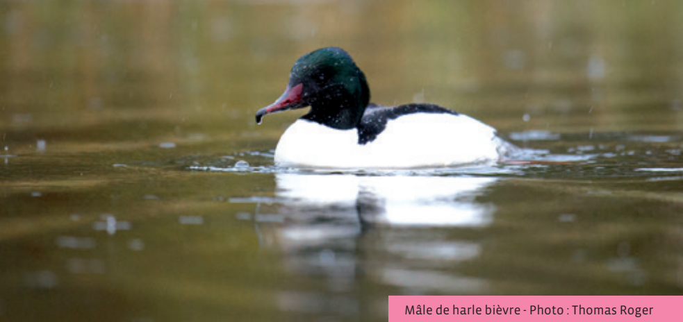
Mâle de harle bièvre

La faune du site se distingue surtout par sa richesse en oiseaux et en insectes, notamment les papillons. Les inventaires ont permis de dénombrer cinquante-deux espèces d'oiseaux, dont trente-huit sont nicheuses sur le site. Beaucoup d'espèces sont ubiquistes* comme la fauvette à tête noire, le pinson des arbres ou encore le rougegorge familier.