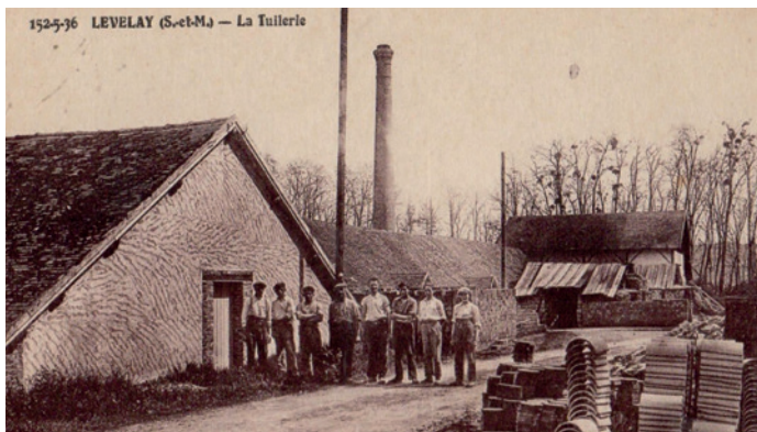
Vers 1900, les ouvriers à l'entrée de la tuilerie.

À la fin du XIX e siècle, l'activité de la tuilerie est très importante. Près de 80 ouvriers s'activent sur le lieu et plus de 60 000 produits (tuiles, briques, faïtières) sont fabriqués par fournée. Un siècle plus tard, Christophe Desagnat n'est qu'un enfant, mais la tuilerie, il la connaît depuis toujours. Dans les années 1980, l'activité diminue. Seuls trois-quatre ouvriers assurent la production, et Christophe décide de venir occasionnellement donner un coup de main : « J'étais principalement chargé de remplir et vider les fours gallo-romains. Mais mon moment favori c'était la sortie des tuiles du four parce qu'on pouvait voir comment le feu sublimait chaque tuile avec des couleurs différentes ». Désormais, Christophe ne travaille plus à la tuilerie mais il apporte tout son soutien au projet de Solange et Désiré. « Je suis heureux que quelqu'un reprenne ce magnifique patrimoine industriel local ».