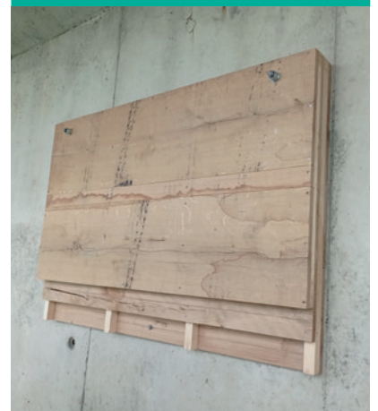
Chacun des quatre gîtes installés peut accueillir jusqu'à 240 chauves-souris.