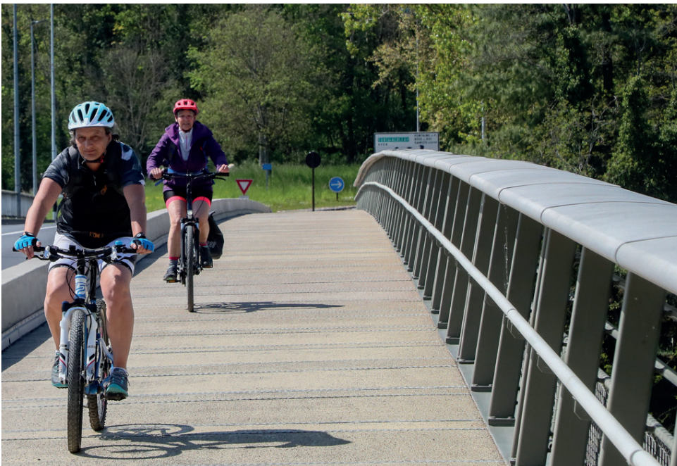
La passerelle, construite en encorbellement, fait partie du tracé de la Scandibérique, une piste cyclable d'envergure européenne.

Non seulement les dortoirs des chiroptères ont été préservés, mais une attention particulière a également été portée à leurs conditions de chasse avec l'éclairage de la passerelle, installée dans la main courante du garde-corps. « Nous avons beaucoup travaillé sur la température de la lumière [ndlr : qui peut être chaude, froide ou neutre]. On sait que les chauves-souris abandonnent des zones de chasse la nuit si la température de la lumière est trop chaude, On a donc mis en place un éclairage diffus, par led, afin que cette température ne soit pas trop importante », précise Éric Thomas. La passerelle, qui a été inaugurée en avril dernier, sera prochainement inspectée. L'occasion de vérifier si les chiroptères ont bien repris possession des lieux.