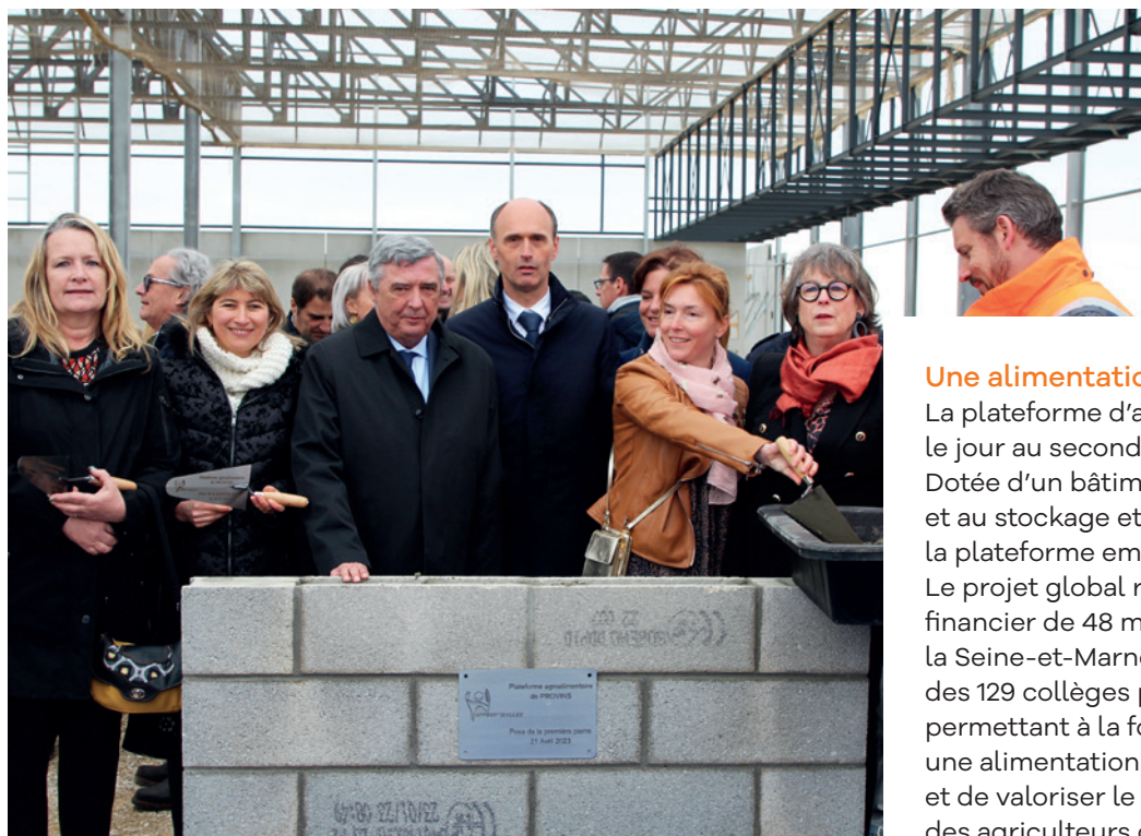
Pose de la première pierre d'Approv'Halles, le 21 avril 2023.