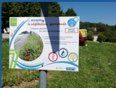
La commune Montgé-en-Goële a remporté le trophée « Zéro Phyt'Eau » en 2016.

Cette année, 28 communes seine-et-marnaises ont arrêté d'utiliser des produits phytosanitaires pour l'entretien de leurs espaces publics. Afin de les récompenser, le Département leur remettra le trophée départemental « ZÉRO PHYT'Eau » mercredi 30 septembre.