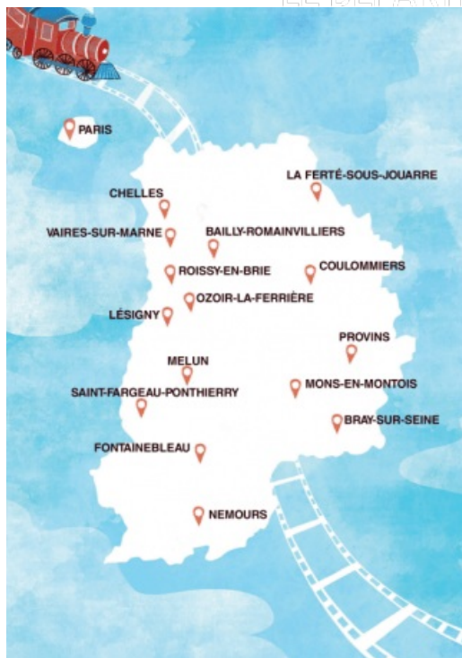
Carte des villes parcourues par le festival Les enfants & le 7e art

Le festival de l'enfant & le 7 e art va à la rencontre du public en parcourant la Seine-et-Marne, avec un passage sur Paris. Pour cette édition, 15 villes seine-et-marnaises seront le décor de ce festival cinéophile :