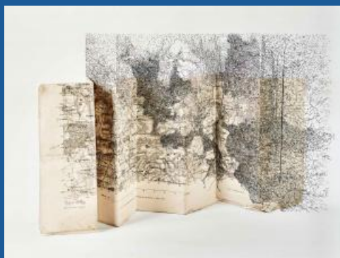
Géo-délocalisation © Bertrand Flachot

Le musée départemental de la Seine-et-Marne situé à Saint-Cyr-sur-Morin accueille du 13 février au 27 novembre 2022 Bertrand Flachot, un artiste plasticien qui mêle le travail de dessin numérique à la photographie. L'exposition de ses œuvres au musée ces derniers