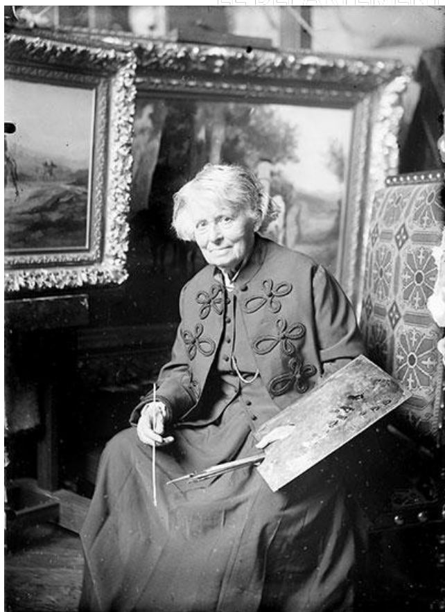
Photographie de Rosa Bonheur posant dans son atelier au Château de By

Pendant 40 ans, Rosa Bonheur a vécu au château de By situé à Thomery en lisière de la forêt de Fontainebleau. Animaux et paysages seine-et-marnais ont inspiré celle qui fut l'artiste femme la plus célébrée de son temps. À l'occasion du bicentenaire de sa naissance le 16 mars 1822, le Département de Seine-et-Marne souhaite faire (r e)découvrir Rosa Bonheur et ses liens forts avec la Seine-et-Marne.