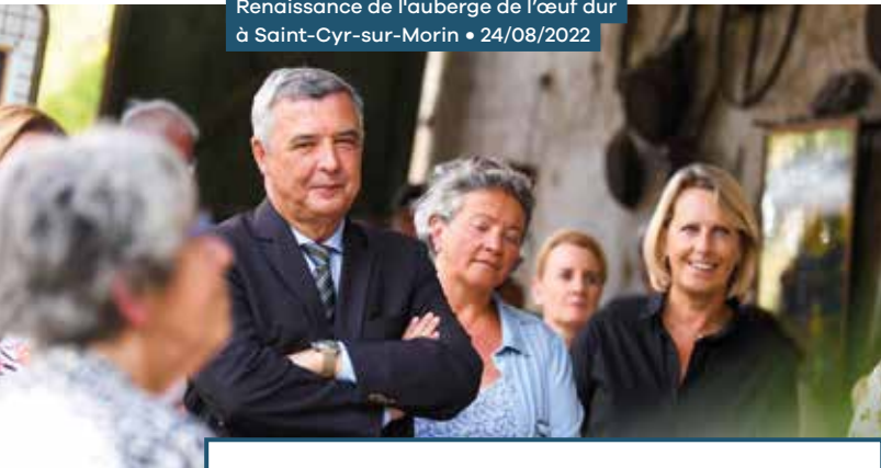
Renaissance de l'auberge de l'œuf dur à Saint-Cyr-sur-Morin • 24/08/2022