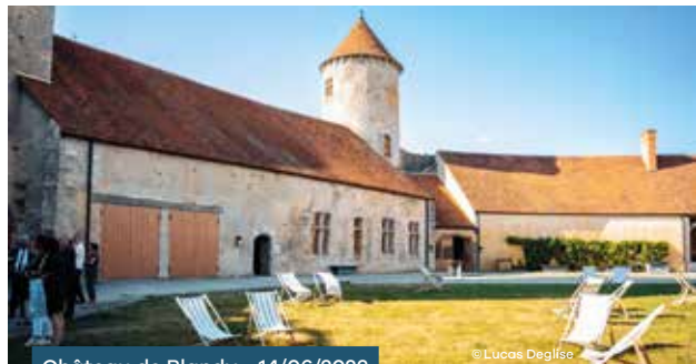
Château de Blandy • 14/06/2023