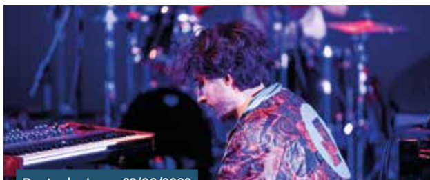
Route du Jazz • 22/03/2023