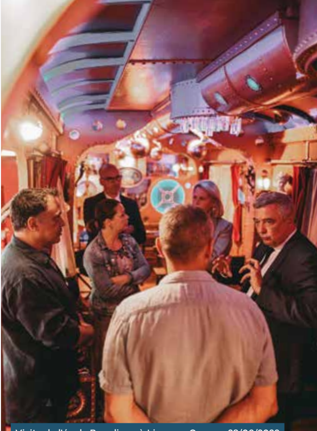
Visite de l'école Bouglione à Lizy-sur-Ourcq • 28/06/2023