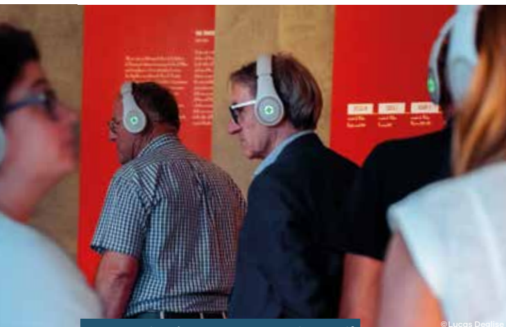
Inauguration du parcours sonore immersif du château de Blandy • 14/06/2023