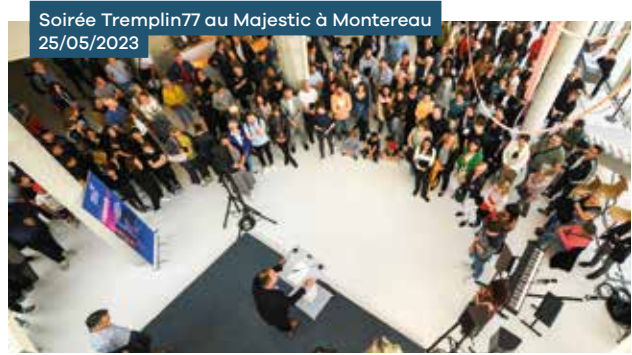
Soirée Tremplin77 au Majestic à Montreuil 25/05/2023