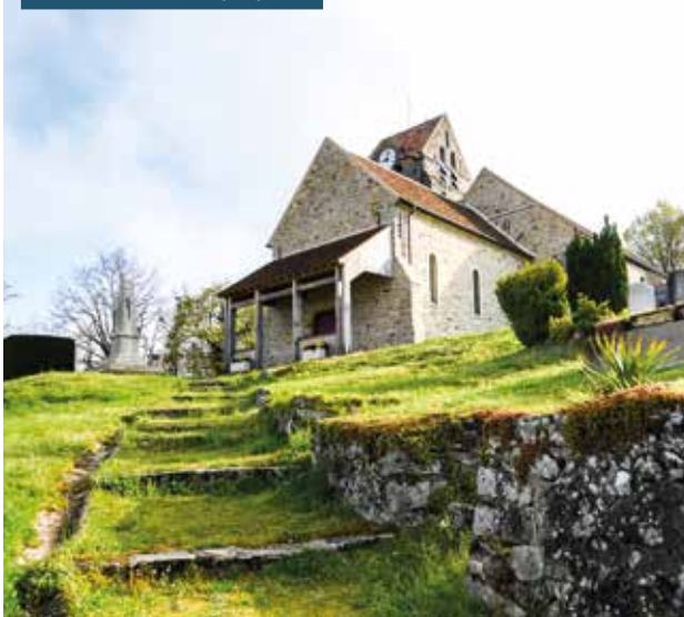
Montmachoux • 25/04/2023

Plus de 3 M € consacrés à l'entretien et la restauration du patrimoine monumental et mobilier des communes depuis le début du mandat