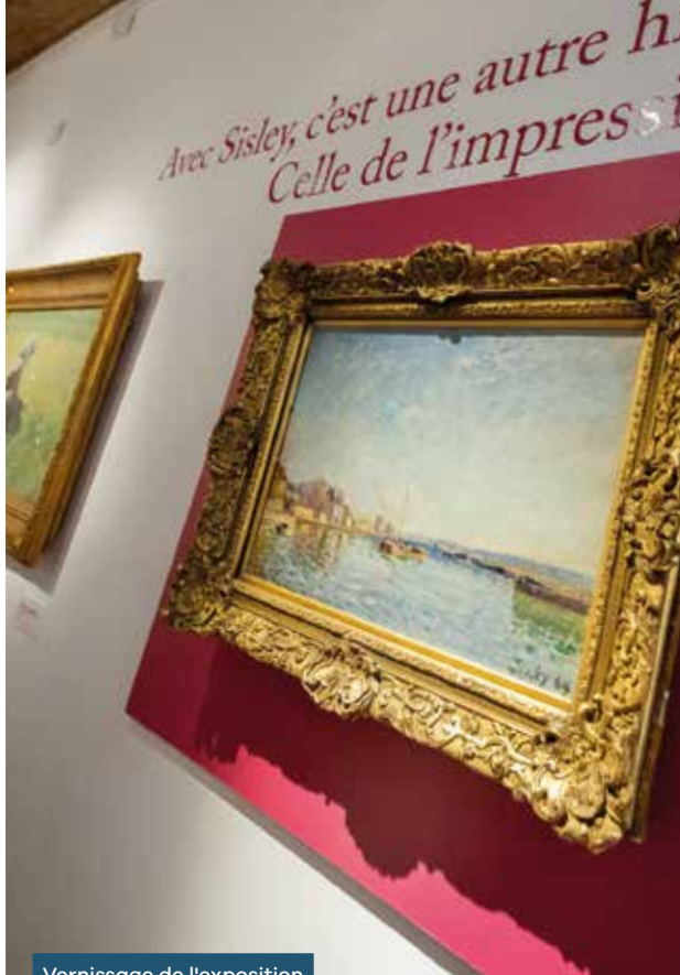
Vernissage de l'exposition L'école du paysage à Barbison • 23/06/2023