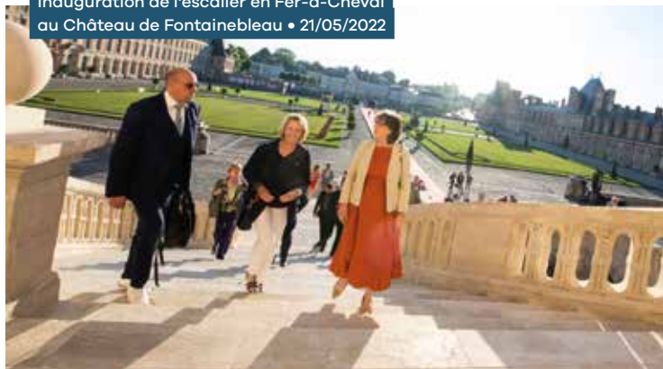
Inauguration de l'escalier en Fer-à-Cheval au Château de Fontainebleau • 21/05/2022