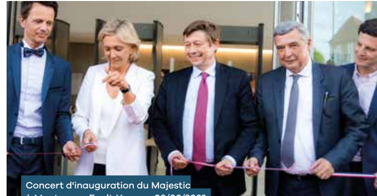
Concert d'inauguration du Majestic à Montereau-Fault-Yonne • 03/06/2022

1,1M € apportés par le Département à la commune de Montereau dans le cadre d'un Fonds d'aménagement communal. Le Département soutient par ailleurs le Majestic chaque année pour son fonctionnement.