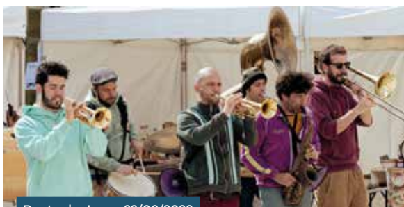
Route du Jazz • 22/03/2023