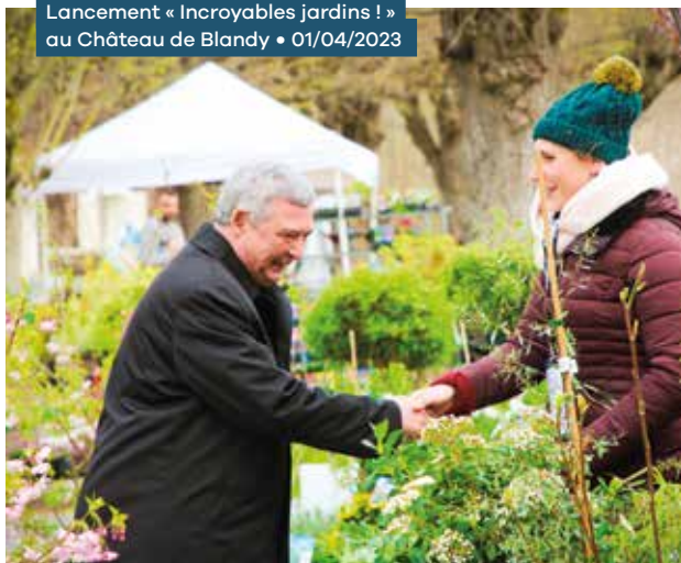
Lancement « Incroyables jardins ! » au Château de Blandy • 01/04/2023

Habilitation par l'État (en octobre 2021) du service archéologique de la Direction des Affaires Culturelles du Département pour la réalisation de diagnostics d'archéologie préventive.