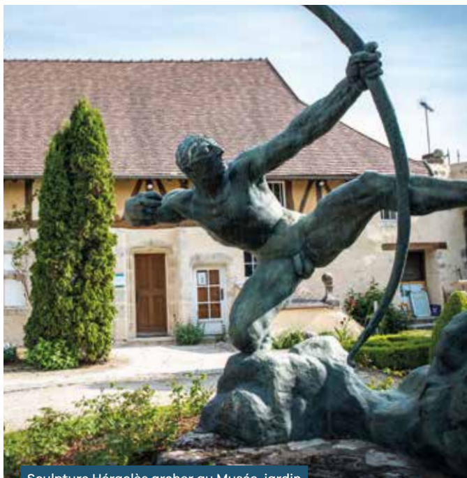
Sculpture Héraclès archer au Musée-jardin Bourdelle à Égreville • 16/02/2023