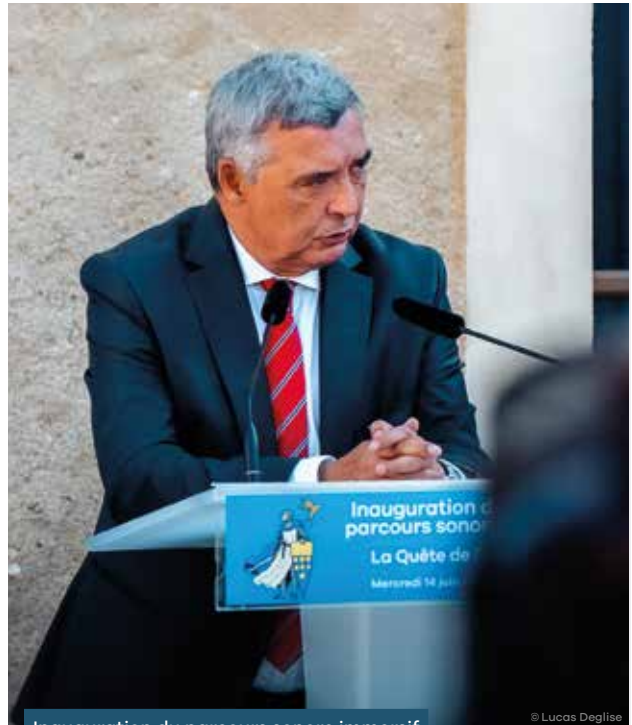
Inauguration du parcours sonore immersif du château de Blandy • 14/06/2023