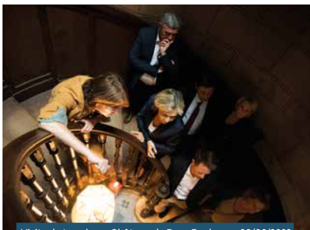
Visite de terrain au Château de Rosa Bonheur • 09/06/2022