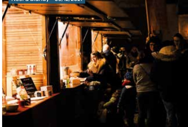
Noël à Blandy - 03/12/2021