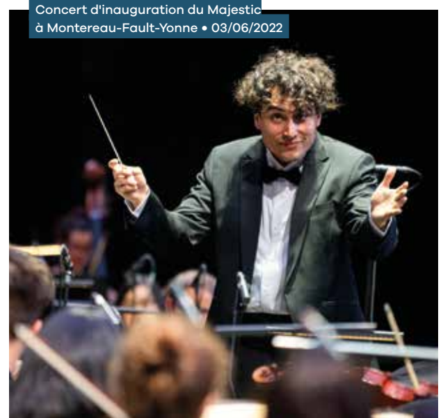
Concert d'inauguration du Majestic à Montereau-Fault-Yonne • 03/06/2022

Plus de 5 M € mobilisés en faveur de 65 équipements culturels