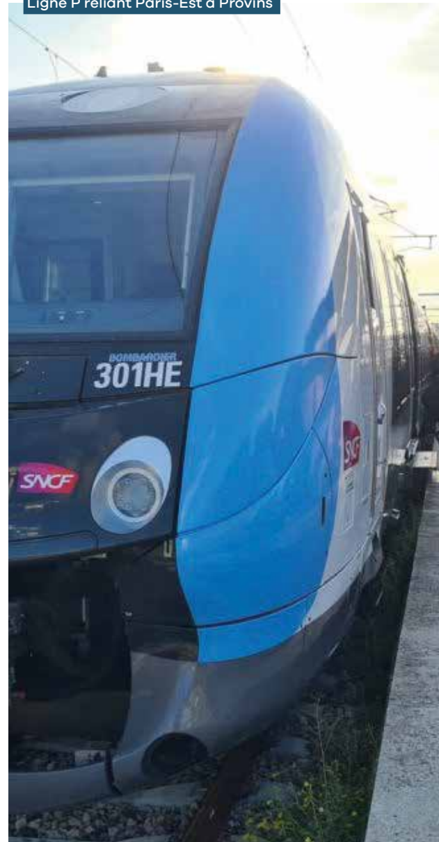
Ligne P reliant Paris-Est à Provins