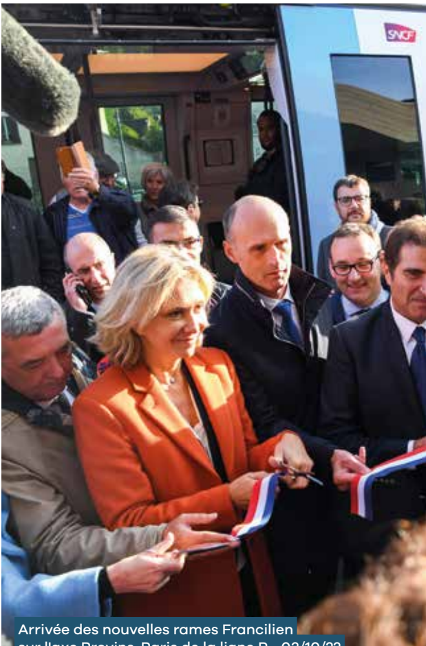
Arrivée des nouvelles rames Francilien sur l'axe Provins-Paris de la ligne P • 03/10/22