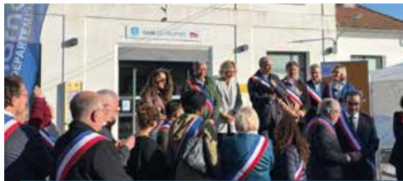
Rassemblement à Trilport pour le projet d'électrification de la ligne P Meaux-La Ferté-Milon • 14/10/23