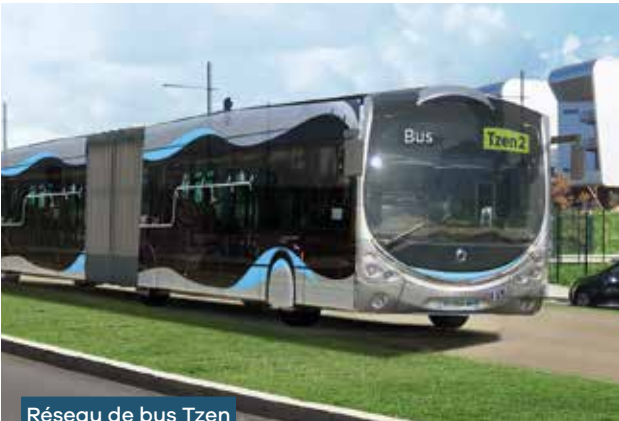
Réseau de bus Tzen