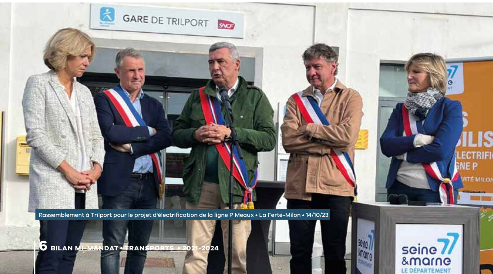
Rassemblement à Trilport pour le projet d'électrification de la ligne P Meaux • La Ferté-Milon • 14/10/23