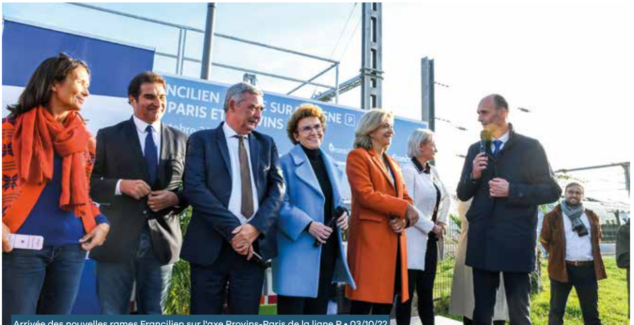
Arrivée des nouvelles rames Francilien sur l'axe Provins-Paris de la ligne P • 03/10/22