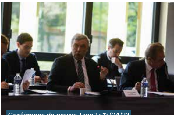
Conférence de presse Tzen2 • 13/04/23

mobilisés par le Département dans ce cadre