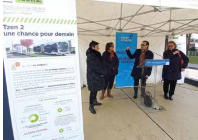
Plantation d'arbres à Savigny-le-Temple dans le cadre du Tzen 2 • 09/03/23