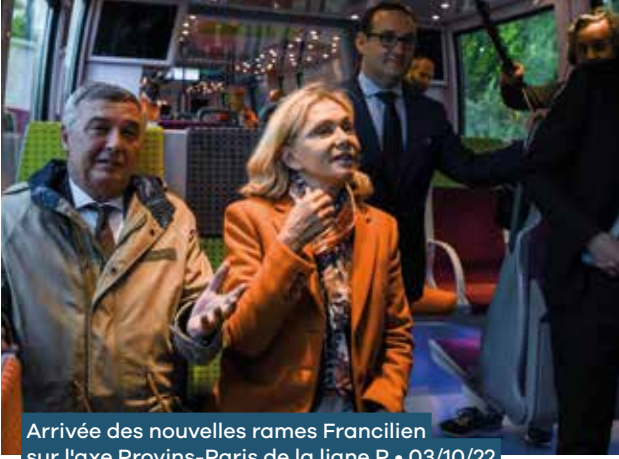
Arrivée des nouvelles rames Francilien sur l'axe Provins-Paris de la ligne P • 03/10/22