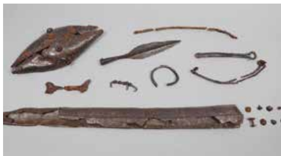
Armes et parures en fer retrouvées dans une sépulture. Saint-Benoît-sur-Seine, « la Perrières » (Aube), sép. 8