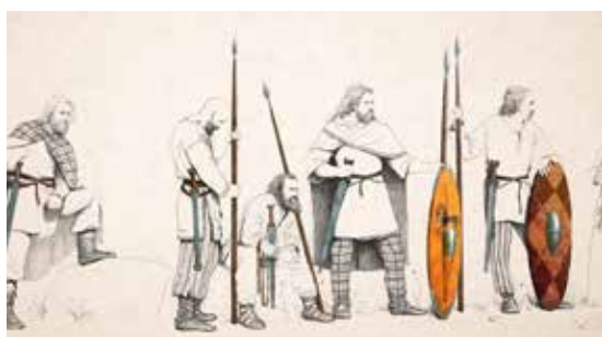
Restitutions de guerriers des IV e et III e siècles avant J.-C. © Jose Cabrera