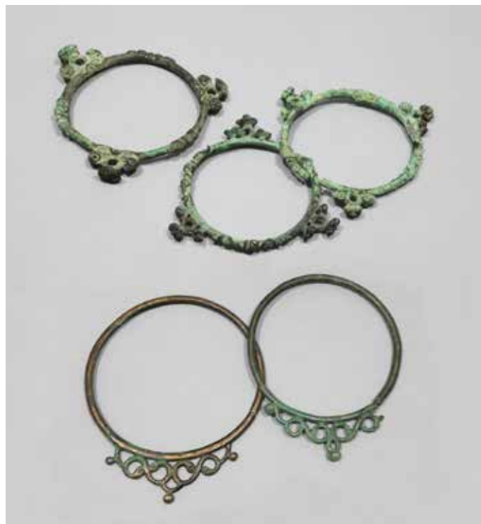
Trois torques ternaires en bronze (Pogny et la Chaussée-sur-Marne, Aube) et deux torques à arceaux en bronze (Environs de Sens, Yonne), IV e siècle avant J.-C.