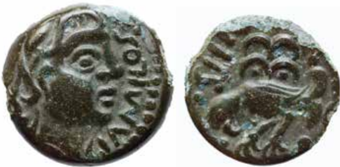
Monnaie sénone frappée en bronze (LT 7565). Droit : Effigie à droite. Légende [G]IAMILOS. Revers : Rapace à gauche, ailes déployées et Légende SIINU