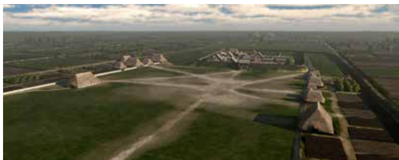
Restitution 3D de l'établissement aristocratique de Batilly-en-Gâtinais, « les Pierrières » (Loiret)