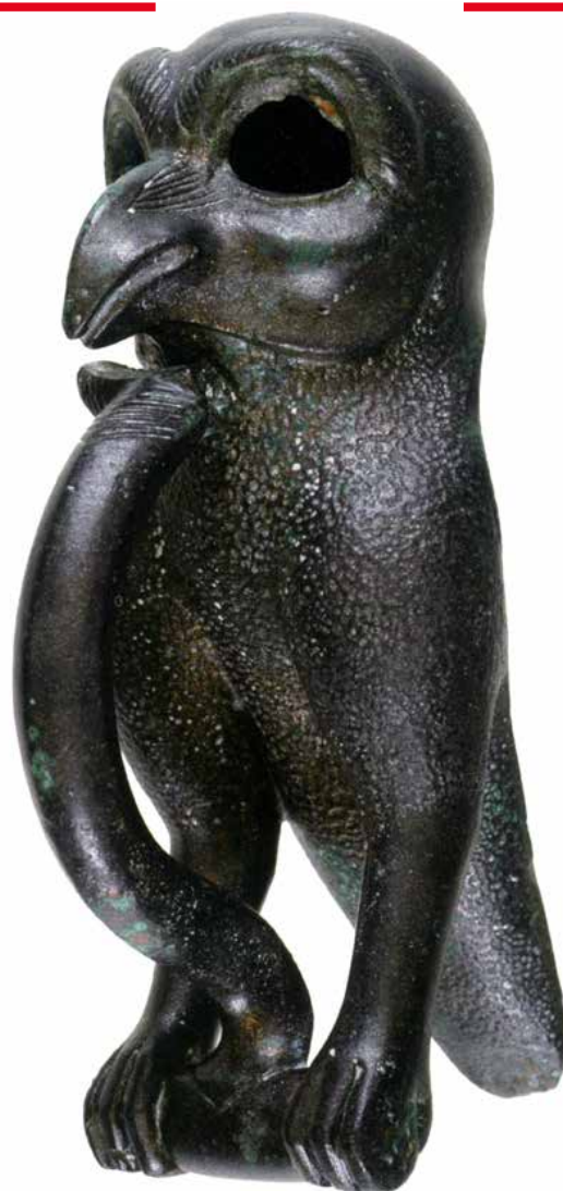
Rapace en bronze. Batilly-en-Gâtinais, « les Pierrières » (Loiret)