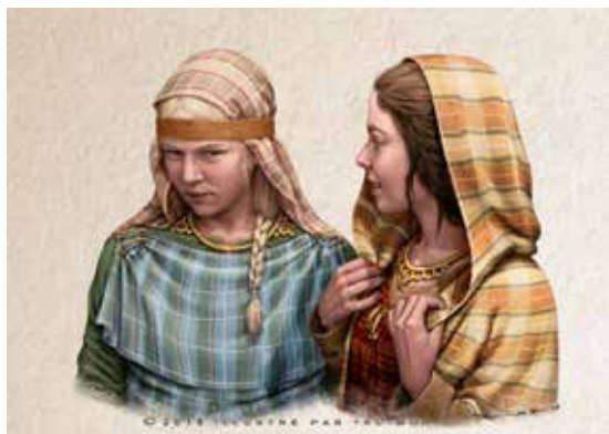
Portrait de deux femmes portant respectivement un torque ternaire (à gauche) et un torque à arceaux (à droite).