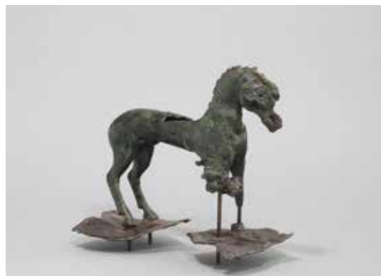
Cheval en bronze. Guerchy, « les Créchaumes » (Yonne)