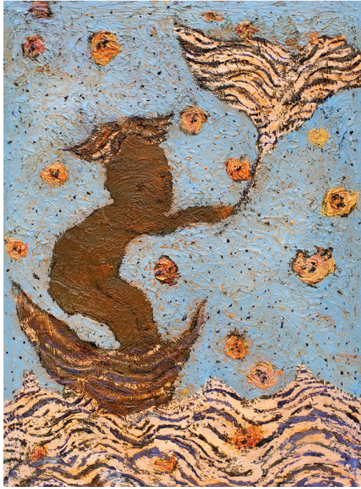
La chasse aux lucioles, peinture sur bois, 2017