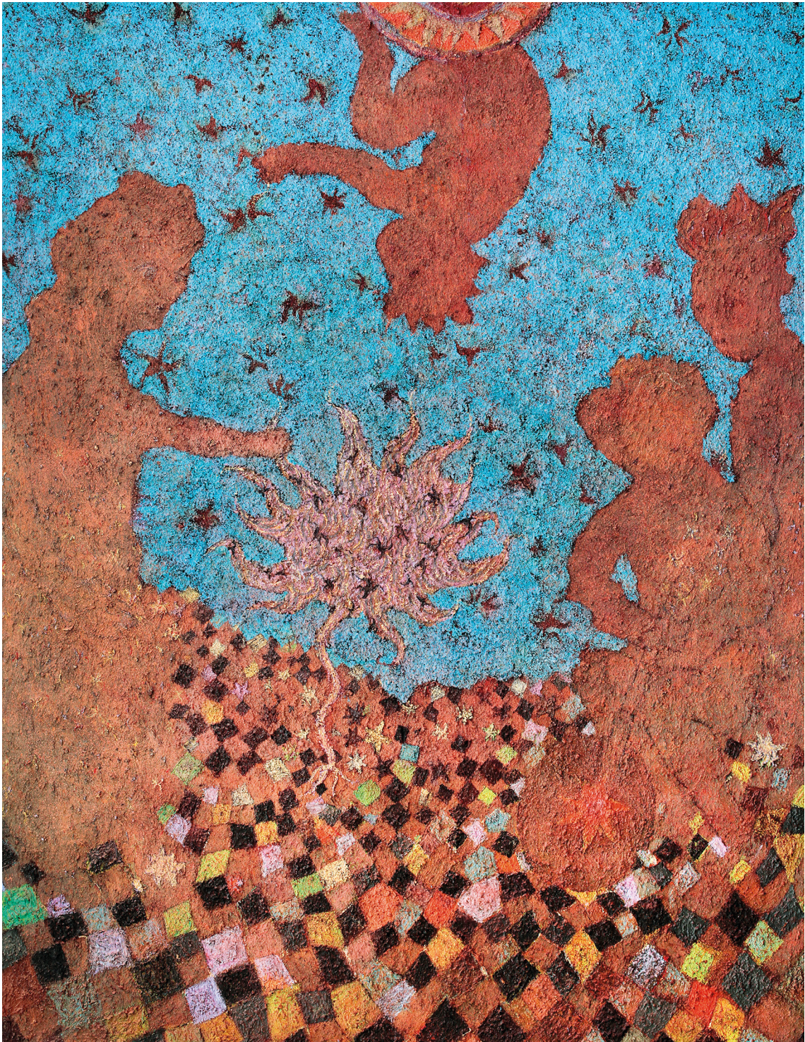
Arc-en-ciel, technique mixte, 2018