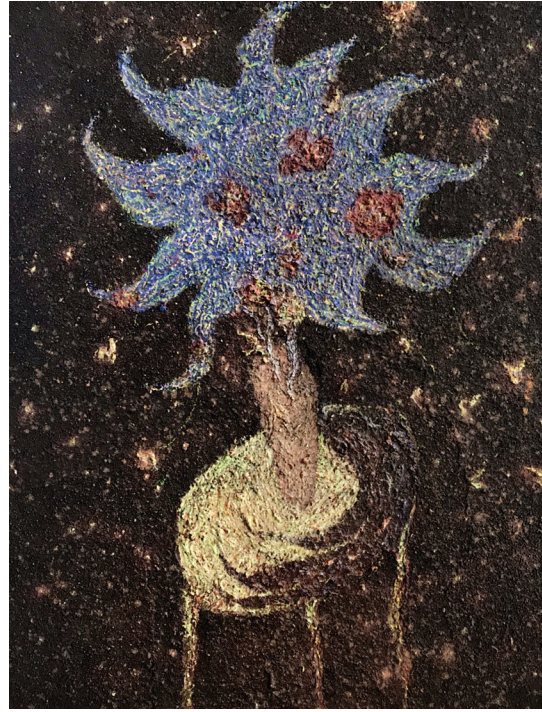
Fleurs, technique mixte, 2018