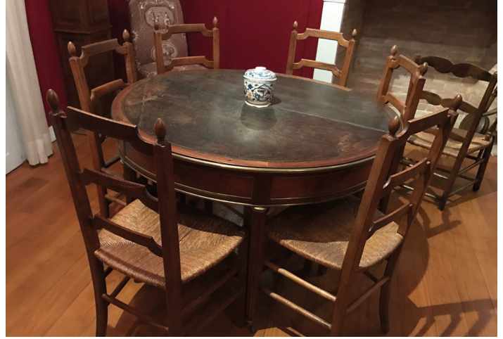
La table des mardis, à Vulaines-sur-Seine (77).