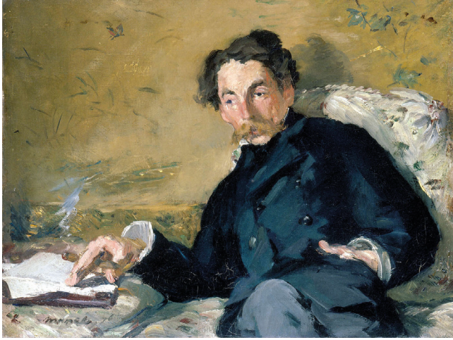
Mallarmé par Manet, 1876