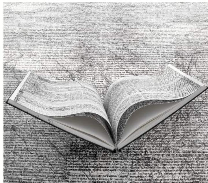
Les chants mur complet