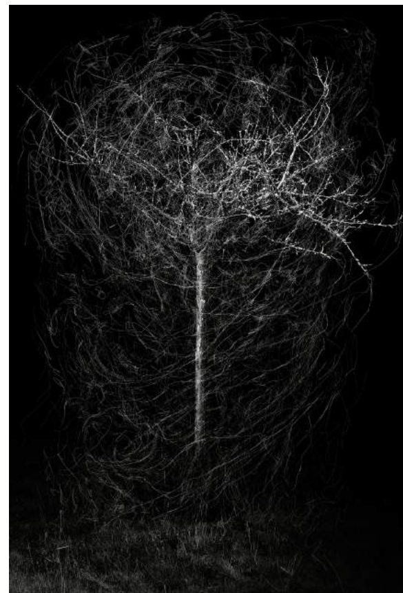
Série Constellation, n°6, phase 0, tirage sur papier Baryté, 1/1, contrecollé sur aluminium avec châssis rentrant, 156 cm x 107,5 cm, 2009.