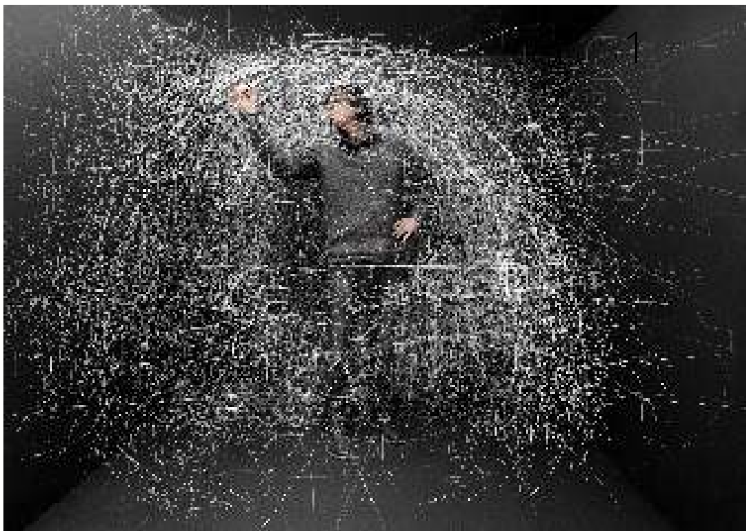
Série Refuge(s), n° 9, tirage jet d'encre pigmentaire sur papier rag 305 gr, contre collé sur alu avec caisse américaine en bois teinté noir ciré, 1/3, 28 cm x 40 cm. 2017