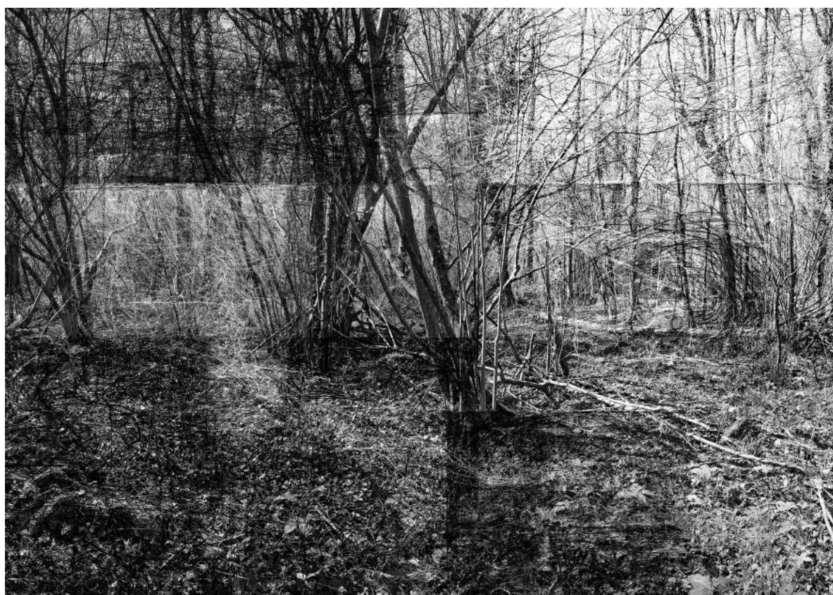
Plan réticulaire n°3, phase 1, C print sur papier satiné, 1/1, contrecollé sur aluminium avec châssis rentrant, 120 cm x 170 cm, 2010.