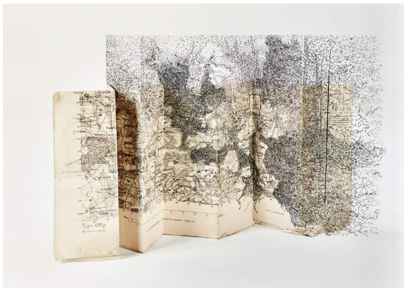
Plan réticulaire n°3, phase 1, C print sur papier satiné, 1/1, contrecollé sur aluminium avec châssis rentrant, 120 cm x 170 cm, 2010.