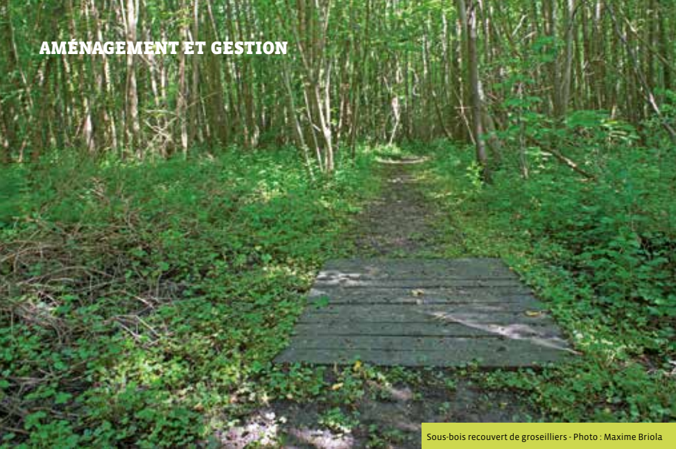
Sous-bois recouvert de groseilliers - Photo : Maxime Briola