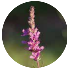
Salicaire commune