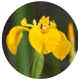
Iris des marais

C'est par leurs fleurs que s'exprime toute la beauté de certaines plantes. Ce calendrier de floraison des principales espèces du site vous permettra d'être à l'heure à chaque rendez-vous. Merci de ne pas les cueillir afin que chacun puisse en profiter.