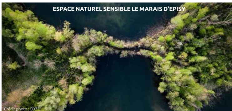
ESPACE NATUREL SENSIBLE LE MARAIS D'EPISY