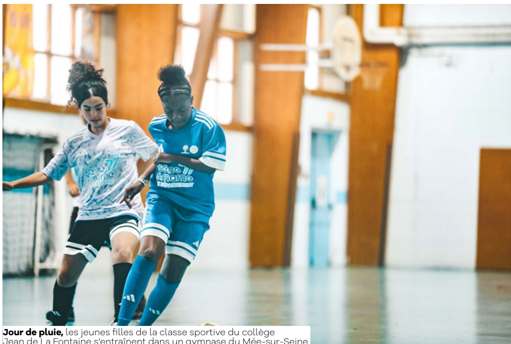
Jour de pluie, les jeunes filles de la classe sportive du collège Jean de La Fontaine s'entraînent dans un gymnase du Mée-sur-Seine.