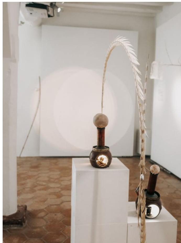
Lanternes magiques d'Émile Kirsch au musée Stéphane Mallarmé.

Le point d'orgue de ce travail est l'exposition « Constellation », visible au musée Stéphane Mallarmé jusqu'au 14 juillet 2026. Ici, le lien école-musée devient concret : ce sont les collégiens eux-mêmes qui ont rédigé les textes explicatifs des œuvres. Pour Émile Kirsch, l'art n'est pas une discipline intimidante, mais une manière de regarder le « presque rien » pour y trouver du sacré. En confiant la plume aux élèves, il prouve que leur regard sur le monde est aussi précieux que celui des experts.