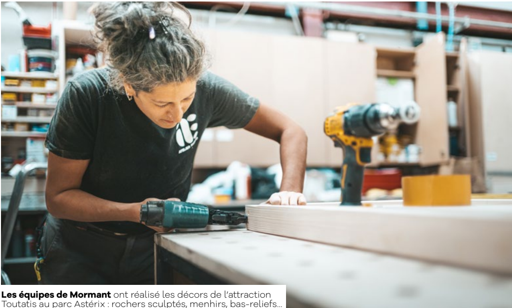
Les équipes de Mormant ont réalisé les décors de l'attraction Toutatis au parc Astérix : rochers sculptés, menhirs, bas-reliefs...

Atelier Emocio crée et fabrique, dans ses ateliers de Mormant, des décors et des scénographies qui plongent le visiteur dans un autre univers : parcs à thème, zoos, centres commerciaux, défilés de mode ou émissions télévisées... Rencontre avec ces créateurs d'émotions.