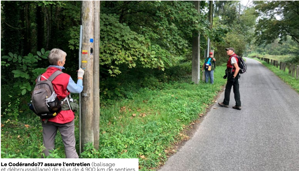
Le Codérando77 assure l'entretien (balisage et débroussaillage) de plus de 4 900 km de sentiers.