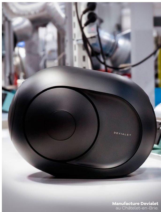
Manufacture Devialet au Châtelet-en-Brie.

Et la dynamique ne s'arrête pas là : l'agroalimentaire innove aussi avec Yumgo (Moissy-Cramayel) et ses alternatives végétales à l'œuf, l'optique avec BBGR (Poigny) et ses