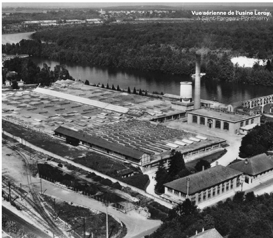
Vue aérienne de l'usine Leroy à Saint-Fargeau-Ponthierry.

L'industrie seine-et-marnaise entre dans une nouvelle phase : automatisation, digitalisation, décarbonisation. La transition environnementale d'une partie du tissu industriel est en cours : Stooly, avec ses meubles pliables en carton, vient de relocaliser son entreprise de production à Chalifert ; Vesto reconstruit du matériel pour la restauration collective à Compans ; Wall up Préfa à Aulnoy transforme le chanvre pour construire et isoler des bâtiments. L'industrie de demain est déjà là.